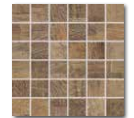
DDM05709 (SET) PEI 4 \odot 72 / set mat | matt hnědá / brown / brązowa коричневый / barna / marrón