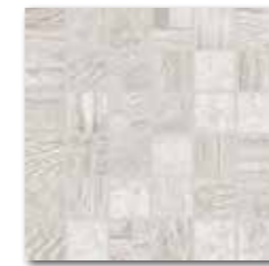
DDM05706 (SET) PEI 5 \odot 72 / set mat | matt bílá / white / biata / белый fehér / blanco