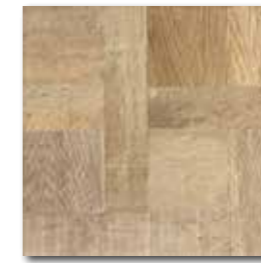
DAR3B707 PEI 4 \odot 72 / m 2 mat | matt