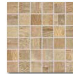
DDM05707 (SET) PEI 4 \odot 72 / set mat | matt běžová / beige / beżowa бежевый / bézs / beige