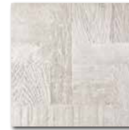
DAR3B706 PEI 5 \odot 72 / m 2 mat | matt