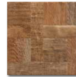
DAR3B708 PEI 4 \odot 72 / m 2 mat | matt