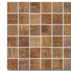
DDM05708 (SET) PEI 4 \odot 72 / set mat | matt červeno-hnědá / red-brown czegwono-brązowy красно-коричневый vörösésbarna de color marrón rojizo