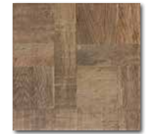
DAR3B709 PEI 4 \odot 72 / m 2 mat | matt