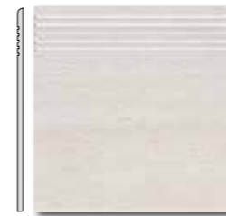
DCA35030 DCP35030 PEI 5 \odot 44 / ks mat | matt

hnědá / brown / brązowa коричневый / marrón