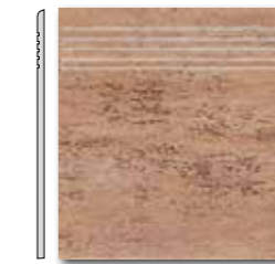
DCP35037 PEI 5 \odot 44 / ks mat | matt