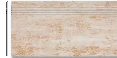
DCPSE035 PEI 5 \odot 72 / ks mat | matt

slonová kost / ivory / kość stoniowa слоновая кость / марfil