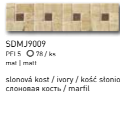
SDMJ9009 PEI 5 \odot 78 / ks mat | matt

slonová kost / ivory / kość stoniowa слоновая кость / марfil