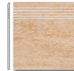
DCP35034 PEI 5 \odot 44 / ks mat | matt