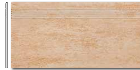
DCPSE034 PEI 5 \odot 72 / ks mat | matt