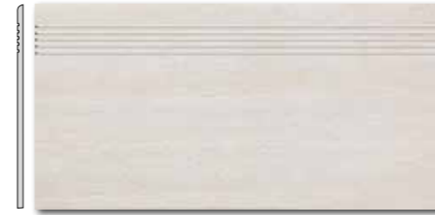
DCPSE030 PEI 5 \odot 72 / ks mat | matt

slonová kost / ivory / kość stoniowa слоновая кость / марfil