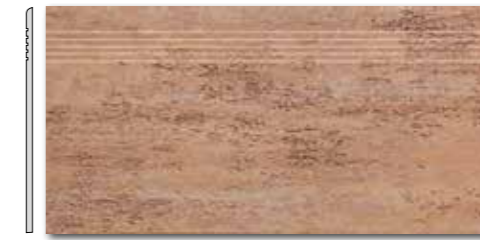
DCPSE037 PEI 5 \odot 72 / ks mat | matt

hnědá / brown / brązowa коричневый / marrón