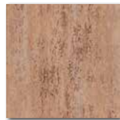
DAR35037 PEI 5 \odot 72 / m 2 mat | matt

hnědá / brown / brązowa коричневый / marrón