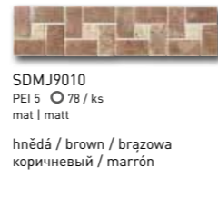
SDMJ9010 PEI 5 \odot 78 / ks mat | matt

slonová kost / ivory / kość stoniowa слоновая кость / марfil