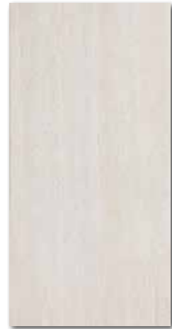
DARS030 PEI 5 \odot 76 / m 2 mat | matt