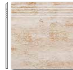
DCP35035 PEI 5 \odot 44 / ks mat | matt