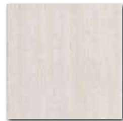
DAR35030 PEI 5 \odot 72 / m 2 mat | matt

slonová kost / ivory / kość stoniowa слоновая кость / марfil