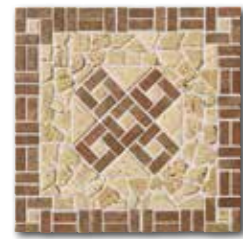
SDM35009 PEI 5 \odot 102 / ks mat | matt