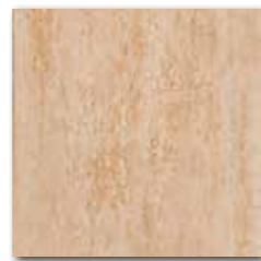
DAR35034 PEI 5 \odot 72 / m 2 mat | matt