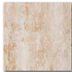
DAR35035 PEI 5 \odot 72 / m 2 mat | matt

slonová kost / ivory / kość stoniowa слоновая кость / марfil