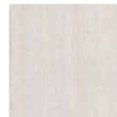
DAR35030 Travertin PEI 5 ○ 72 / m 2 mat | matt

slonová kost / ivory / kość sloniowa / слоновья кость / marfil