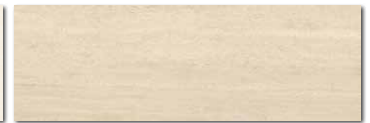
WADV5002 ○ 86 / m 2 mat | matt

světle béžová / light beige / jasnobéžowa / светло-бежевый / beige claro