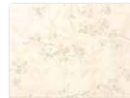
WITKB054 ○ 58 / ks mat | matt