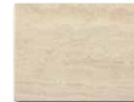
WADKB002 ○ 68 / m 2 mat | matt | v2