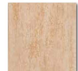
DAR35034 Travertin PEI 5 ○ 72 / m 2 mat | matt

béžová / beige / bežowa / бежевый / beige