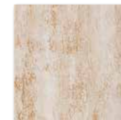
DAR35035 Travertin PEI 5 ○ 72 / m 2 mat | matt

slonová kost / ivory / kość sloniowa / слоновья кость / marfil