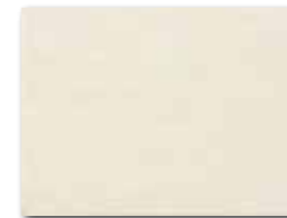
WADKB001 ○ 68 / m 2 mat | matt | v2

béžová / beige / bežowa / бежевый / beige