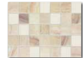
WADKB004 ○ 78 / m 2 mat | matt | v4 vícebarevná / multicoloured / kolorowa многоцветный / multicolor