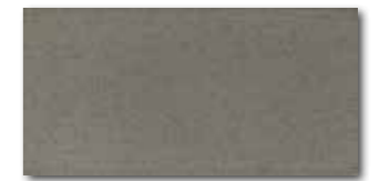
WATMB046 ○ 72 / m 2 mat/lesk | matt/glossy šedohnědá / grey-brown / szarobrązowa серо-коричневый / gris-marrón