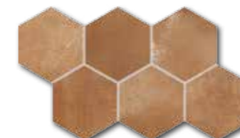
DDVT8713 (SET) PEI 4 \odot 74 / set mat | matt

červeno-hnědá / red-brown / czerwono-brązowa красно-коричневый / marrón rojizo