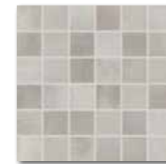
DDM05711 (SET) PEI 4 \odot 72 / set mat | matt