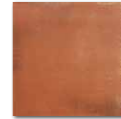
DAR34712 PEI 4 \odot 74 / m 2 mat | matt