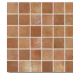
DDM05713 (SET) PEI 4 \odot 84 / m 2 mat | matt