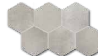
DDVT8711 (SET) PEI 4 \odot 74 / set mat | matt