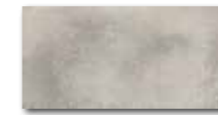
DARJH711 PEI 4 \odot 84 / m 2 mat | matt