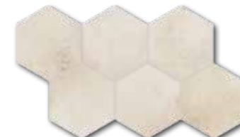
DDVT8710 (SET) PEI 5 \odot 74 / set mat | matt