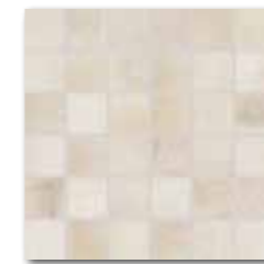
DDM05710 (SET) PEI 5 \odot 72 / set mat | matt