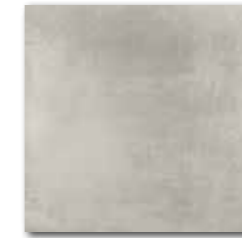
DAR34711 PEI 4 \odot 74 / m 2 mat | matt