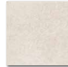
DAR34710 PEI 5 \odot 74 / m 2 mat | matt