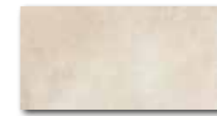
DARJH710 PEI 5 \odot 84 / m 2 mat | matt