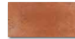
DARJH712 PEI 4 \odot 84 / m 2 mat | matt