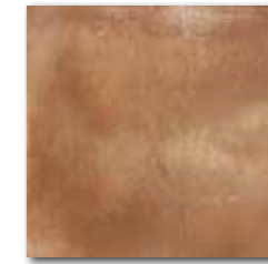
DAR34713 PEI 4 \odot 74 / m 2 mat | matt