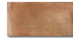
DARJH713 PEI 4 \odot 84 / m 2 mat | matt