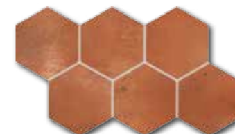
DDVT8712 (SET) PEI 4 \odot 74 / set mat | matt